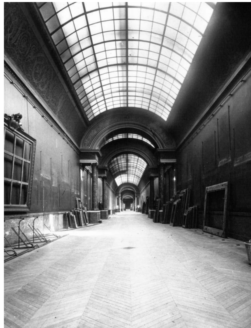
Illustration : Le musée du Louvre pendant la guerre : la grande galerie. Photographie de presse, agence Meurisse. Source gallica.bnf.fr/ Bibliothèque nationale de France – Graphisme JA Bresch

Université Paris Ouest Nanterre La Défense Centre allemand d'histoire de l'art, Paris Deutsches Forum für Kunstgeschichte Paris