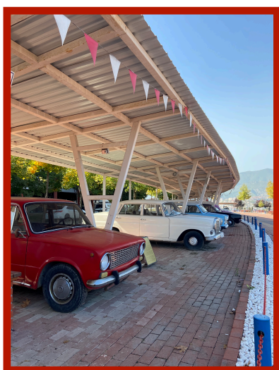
Un musée dédié aux voitures est présent sur le campus.