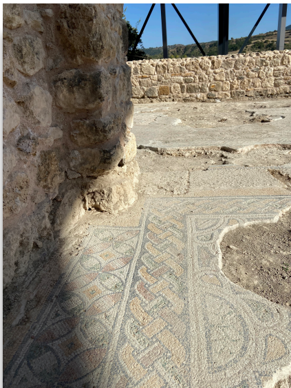
Mosaïque de la Villa romaine

En tant qu'étudiant en archéologie, visiter Hadrianapolis représentait bien plus qu'une simple excursion touristique. Partir souvent visiter le site archéologique d'Hadrianapolis a été l'une des expériences les plus mémorables de mon parcours Erasmus en Archéologie à l'université de Karabük en Turquie. Hadrianapolis, est un site historique d'une importance exceptionnelle, situé à proximité de la ville de Karabük. Le site regorge de vestiges impressionnants, allant de la nécropole aux mosaïques et aux thermes. Mes visites fréquentes à Hadrianapolis ont été parmi les moments les plus marquants de mon expérience Erasmus en Turquie. Elles m'ont permis de plonger au cœur de l'histoire antique, d'approfondir mes connaissances en archéologie et de vivre des moments de découvertes.