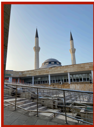
La mosquée du campus